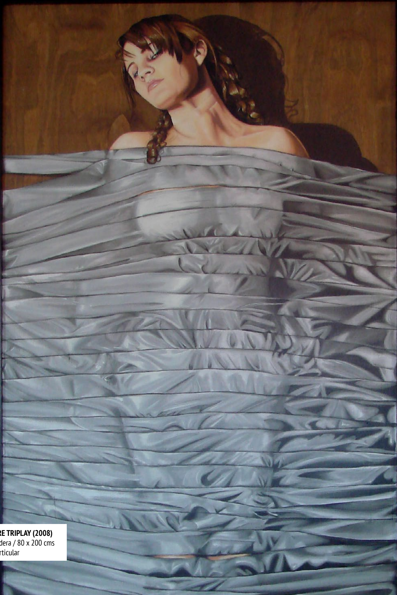
MUJER SOBRE TRIPLAY (2008)

Acrílico / Madera / 80 x 200 cms Colección Particular